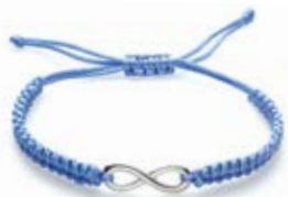
Браслет «Гармония» Размер: 26,2 см. Материал: шелковая нить. 09832