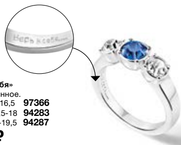
Кольцо «Верь в себя» Посеребрённое. Размер 16-16,5 97366 Размер: 17,5-18 94283 Размер: 19-19,5 94287