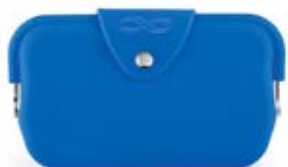
Кошелек «Гармония» Размер: 16x9x2 см. Материал: силикон. 09832 вмещает смартфон используй как косметичку используй как кошелек