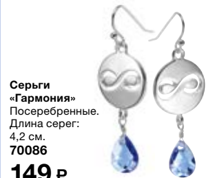
Серьги «Гармония» Посеребрённые. Длина серег: 4,2 см. 70086